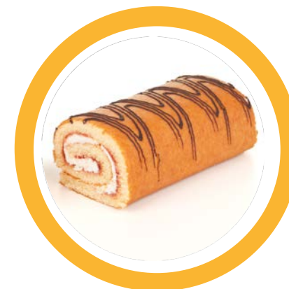
Bolos, tortas, cuques

Produtos para desjejum, café da manhã, coffee break, merenda, lanches especiais.