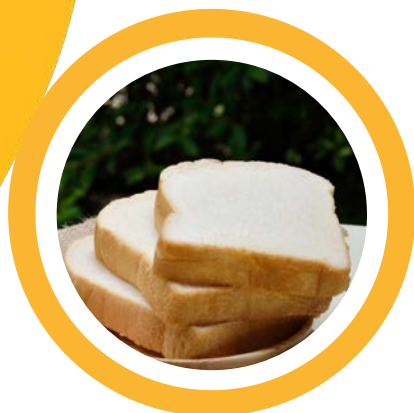
Pães, broas, fatiados

Soluções de cardápio para todos os segmentos. Nossa linha é composta por: