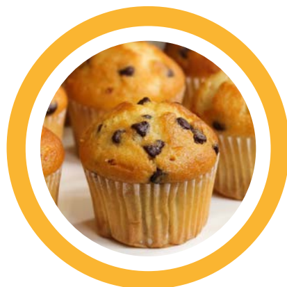
Confeitos, muffins, roscas, biscoitos